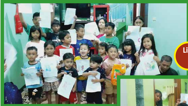
Lingkungan Carolus Borromesus