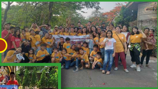
Lingkungan Leo Agung