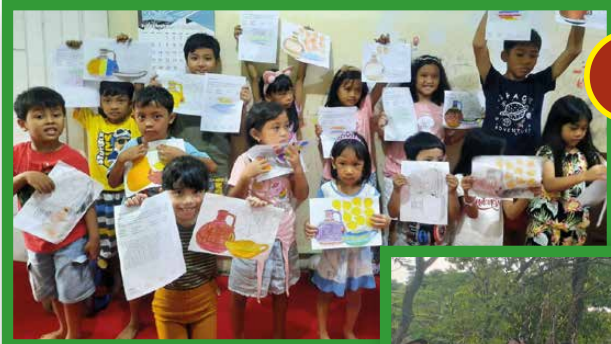
Lingkungan Keluarga Kudus