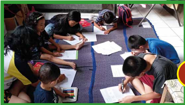
Lingkungan Ratu Rosari