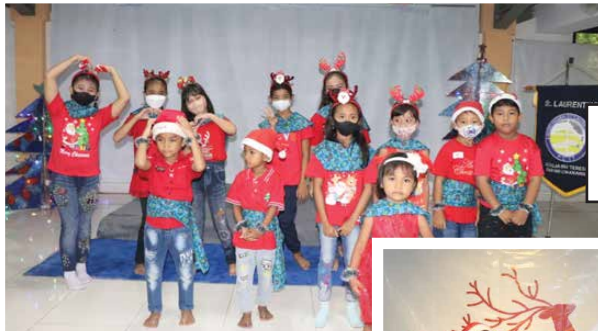
Performance BIA Sub Lingkungan Permata Cikarang Timur