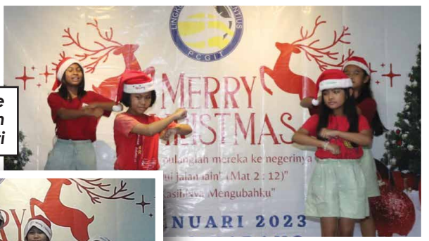
Performance BIA Sub Lingkungan Cipaganti