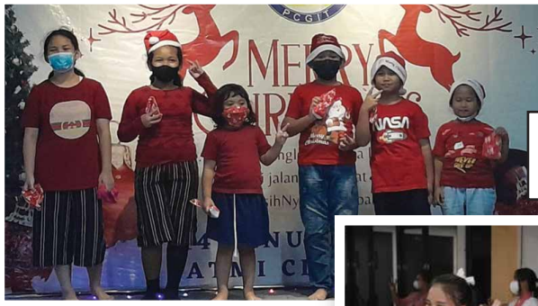
Performance BIA Sub Lingkungan Garden Ville