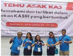
Pengurus ASAK Cikarang menghadiri event "TEMU ASAK KAJ"