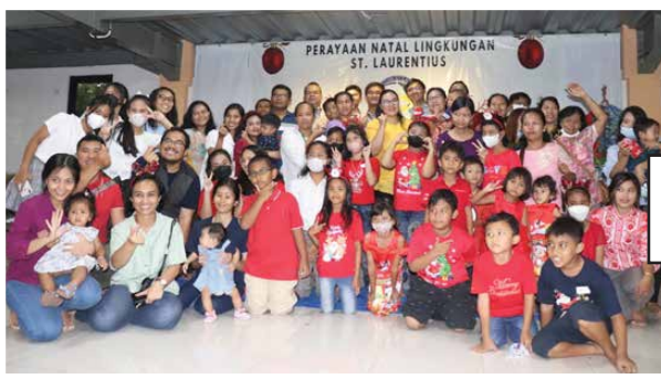
Foto Bersama Umat Lingkungan Laurentius