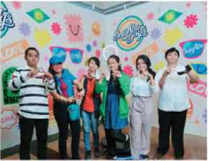
Anak ASAK mengikuti event "Brighter Day - LOJF Conference" Sabtu, 5 November 2022.