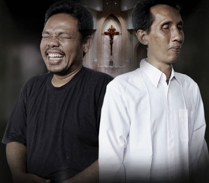
BOHO SITO HANG