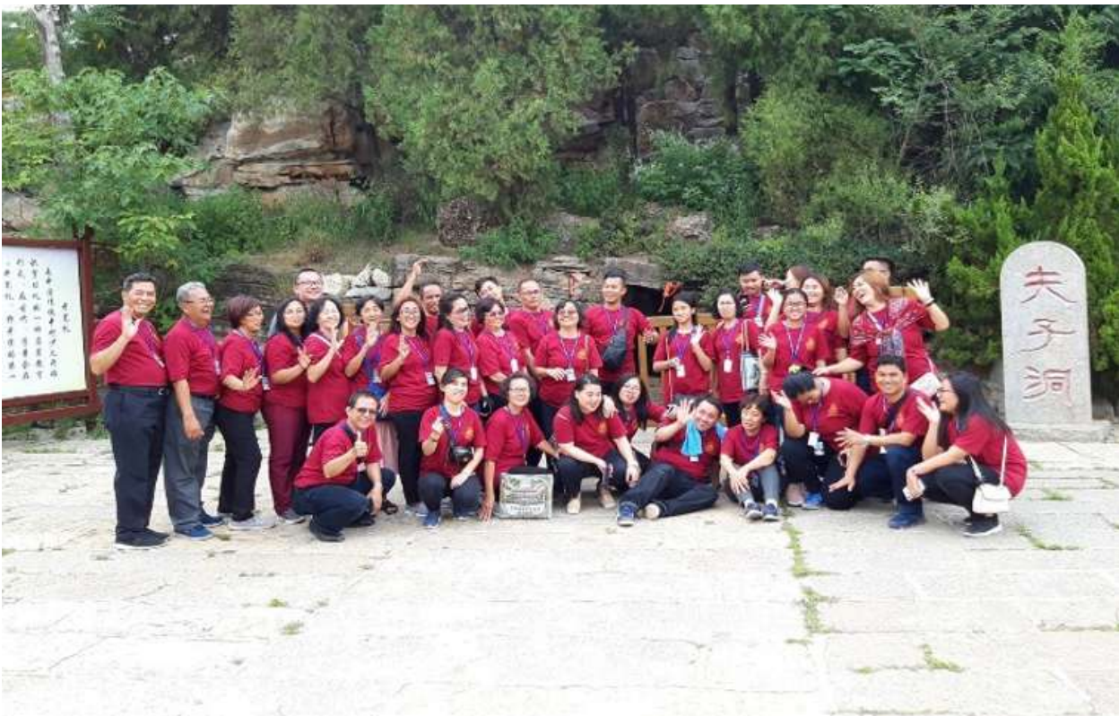
Gambar 5. Fu Zi Dong (Gua tempat kelahiran Nabi Kongzi)

Etika ekologi Khonghucu dapat mengarahkan orang dalam memahami dan menangani dengan benar hubungan antara satu orang dengan yang lain, satu generasi dan yang lain, individu dan masyarakat, dan alam semesta untuk mewujudkan keharmonisan ekologis bagi kebaikan semua umat manusia.