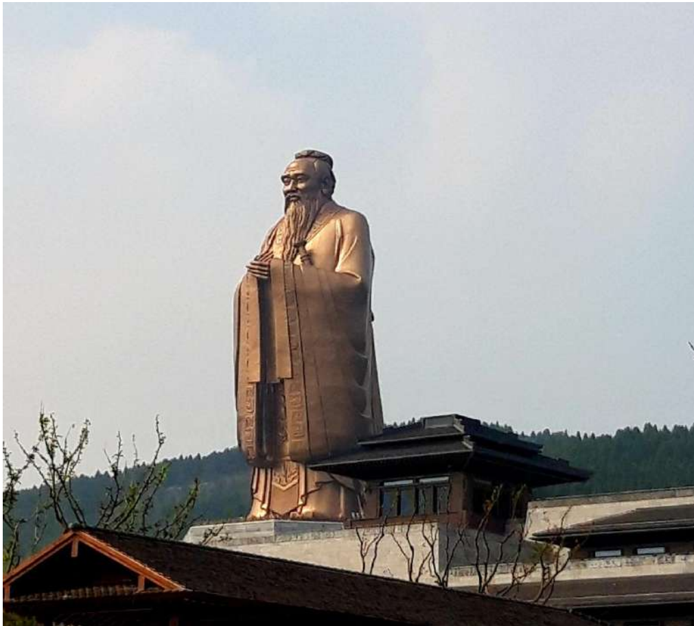
Gambar 7. Jin Shen Nabi Kongzi di Nishan