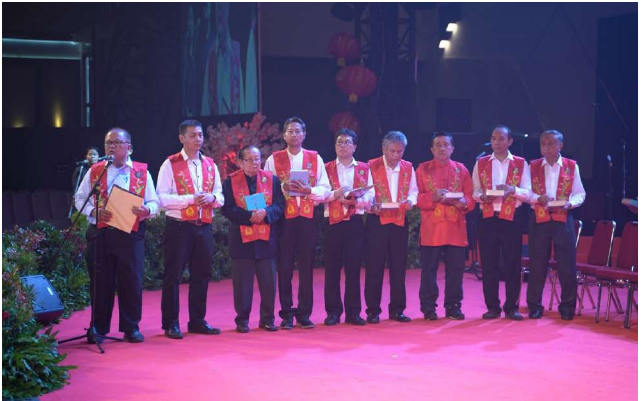
Gambar 8. Peran Rohaniwan