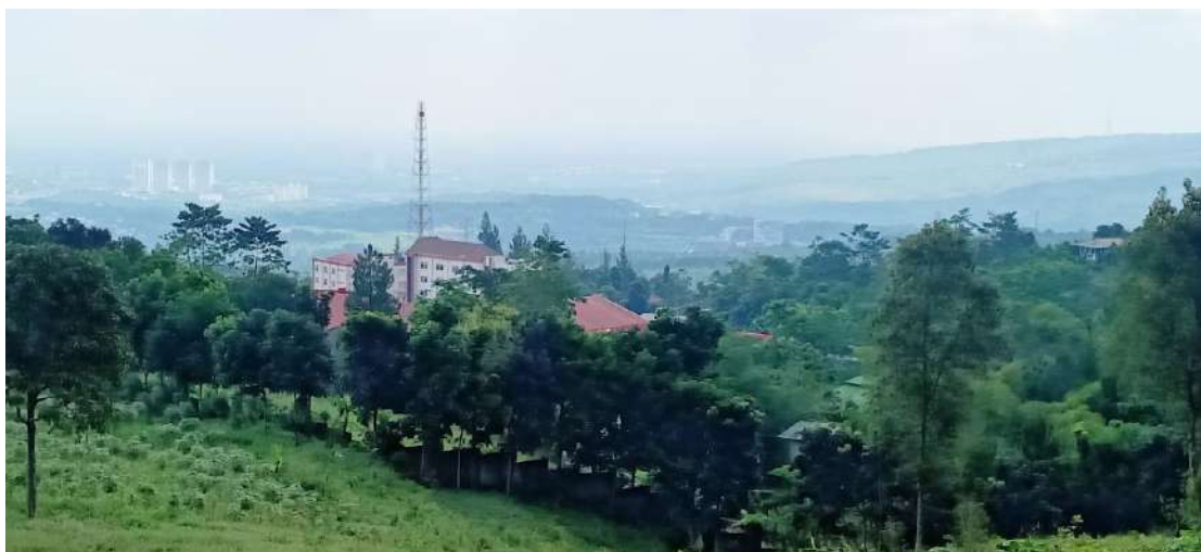
Gambar 1. Hutan

Pola berpikir kita tentang pencegahan penyakit harus berubah sehingga kita perlu mengintegrasikan upaya perlindungan, restorasi dan pengelolaan hutan yang berkelanjutan sebagai langkah preventif untuk mencegah pandemi pada masa depan. Langkah ini termasuk upaya yang memastikan bahwa perburuan dan perdagangan satwa liar hutan-yang berpotensi terjadinya interaksi langsung dengan organisme penyakit—harus aman, legal, dan manusiawi. Berpartisipasi dalam kegiatan restorasi hutan. Program penanaman pohon berbasis masyarakat dan proyek restorasi hutan lainnya yang membantu memulihkan kesehatan ekosistem dan keanekaragaman hayati hutan adalah cara konkrit untuk meningkatkan jasa lingkungan dalam penata-laksanaan penyakit yang selama ini didukung oleh hutan yang sehat. Melakukan advokasi untuk perlindungan hutan sebagai prioritas pencegahan penyakit. (hsg)