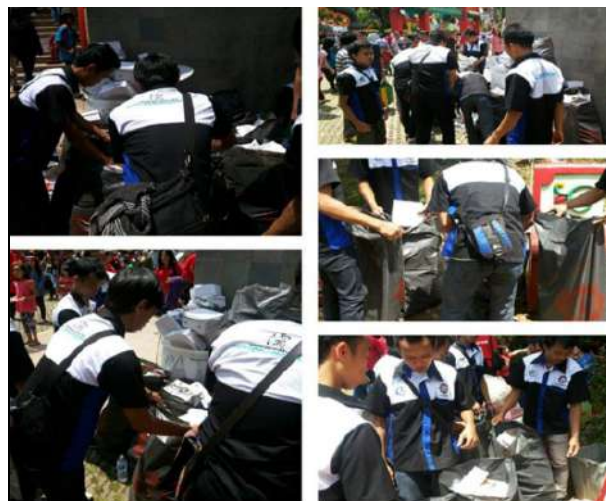
Gambar 4. Generasi Muda Khonghucu Indonesia (GEMAKU) Peduli Lingkungan

Dalam ayat tersebut diatas, Kongzi menegaskan bahwa teladan dari karya Sang Pencipta (Langit) atau alam semesta haruslah diikuti. Penegasan tersebut menunjukkan bagaimana konsep kesatuan harmonis antara manusia dan alam semesta.