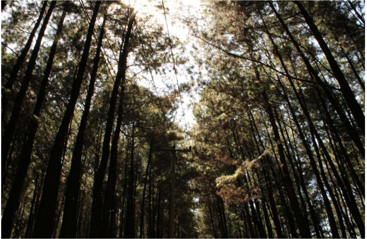
Gambar 2. Hutan