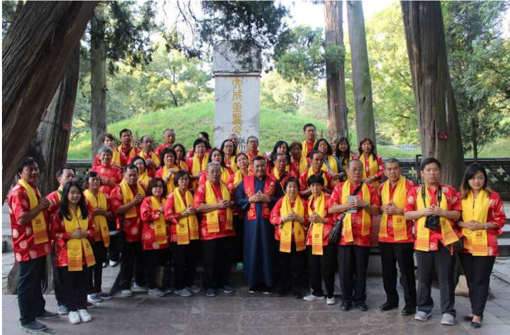
Gambar 3. Makam Nabi Kongzi di Konglin (Qufu)

Sejak beratus-ratus tahun yang lalu, selalu saja terdapat orang-orang mengambil sikap yang tidak terkendali dan dengan sengaja merusak alam, khususnya hutan untuk tujuan ekonomi dan kerakusan lainnya. Alam tidak tinggal diam, dan membalas perbuatan manusia melalui banjir, polusi udara, pemanasan global dan munculnya peristiwa cuaca ekstrim, dan bahkan telah mengakibatkan timbulnya penyakit menular, seperti pandemi COVID-19 dan potensi pandemi lainnya di masa depan yang terkait erat dengan deforestasi tropis, hilangnya habitat dan penurunan ekosistem, dan banyak cara manusia salah dalam mengelola alam. Jadi, ajaran untuk mencintai orang dan makhluk di planet ini, dan untuk menghormati Sang Pencipta dan nenek moyang kita yang mewakili kelangsungan hidup, adalah proposisi yang meneguhkan kehidupan secara serius.